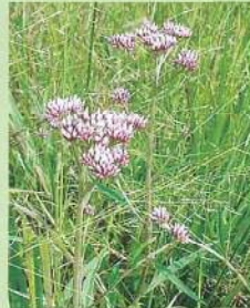
サワヒヨドリ (沢鞠) 花期:8~10月