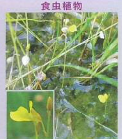
ミミカキグサ (耳掻草) 花期:8~9月