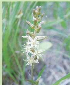
ノギラン (芒蘭) 花期:6~8月