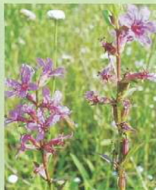
ミノハギ (縹萩) 花期:8~9月