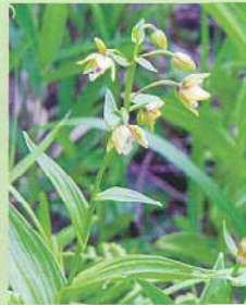
カキラン (柿蘭) 花期:6~7月