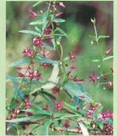
コバノカモメヅル (小葉の鷓鴣) 花期:6~9月