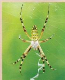
ナガコガネグモ (長黄金蜘蛛) 体長:20~25mm