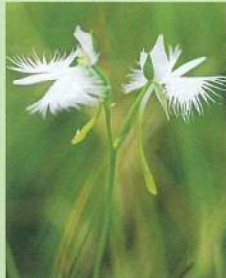
サギソウ (鷺草) 花期:7~8月