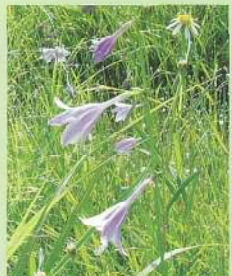
ミズギボウシ (水鏡盆珠) 花期:8~9月