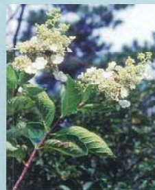
ノリウツギ (榎空木) 花期:7~8月