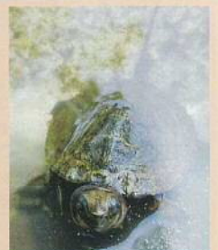
ニホンイシガメ (日本石亀) 体長:14~21cm