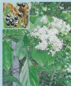
クロミノニシゴリ (黒実の錦織) 花期:5~6月