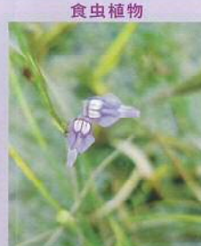
ホザキノミモカキグサ (穂先の耳掻草) 花期:8~9月