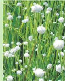
シラタマホシクサ (白玉星草) 花期:8~10月