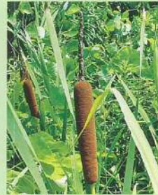
ガマ (蒲) 花期:6~8月