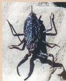
ヒメタイコウチ (姫太鼓打) 体長:20mm