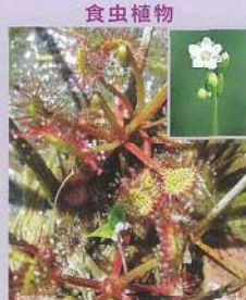
モウセンゴケ (毛氈苔) 花期:6~8月