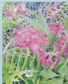
コバノミツバツツジ (小葉の三葉躑躅) 花期:3~4月