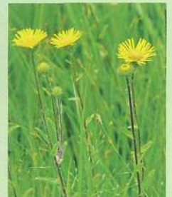
ミズキク (水菊) 花期:7~10月