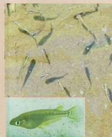
メダカ (目高) 体長:35~40mm