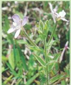
アカバナ (赤葉菜) 花期:7~9月