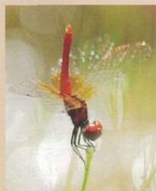
ハッチョウトンボ (八丁蜻蛉) 体長:18~20mm