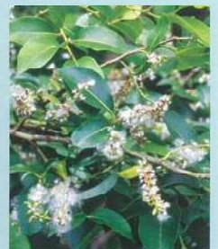
マルバヤナギ (丸葉柳) 花期:4~5月