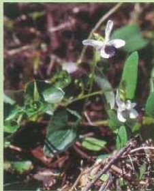
アギスミレ (頸望) 花期:4~6月