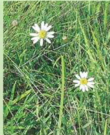
サワシロギク (沢白菊) 花期:8~10月