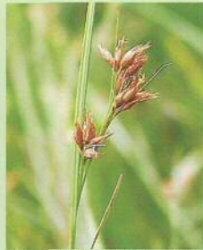
イヌノハナヒゲ (犬の鼻髭) 花期:7~9月