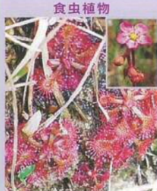
トウカイコモウセンゴケ (東海小毛氈苔) 花期:6~8月