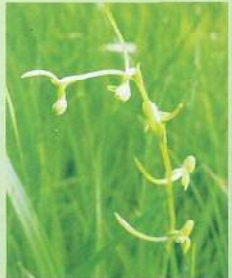
コバノトンボソウ (小葉の蜻蛉草) 花期:6~7月