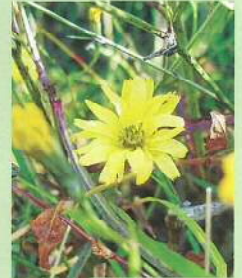
スイラン (水蘭) 花期:9~11月