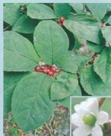
ウメモドキ (梅擬) 花期:6月