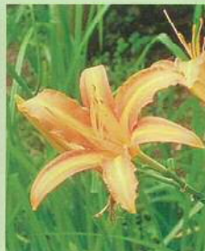
ノカンゾウ (野菅草) 花期:6~7月