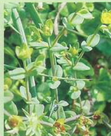
ヒメオトギリ (姫弟切) 花期:7~8月