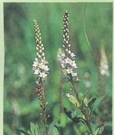
ヌマトラノオ (沼虎の尾) 花期:7~8月