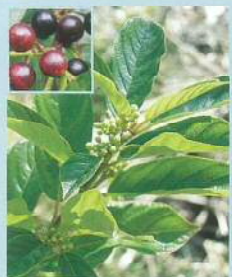
イソノキ (磯の木) 花期:6~7月