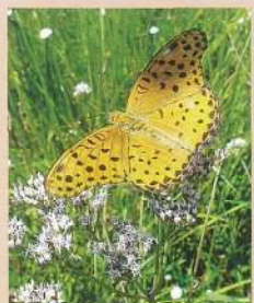
ツマグロヒョウモン 開張:60~70mm (椋黒豹蝶)